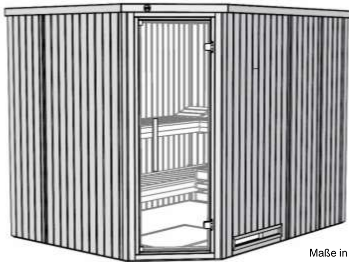
Maße in cm