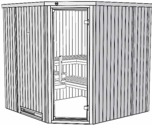
Maße in cm